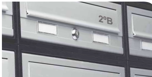
Agrupación de buzones TECNUM H-4302 color plata, con grabación a láser.