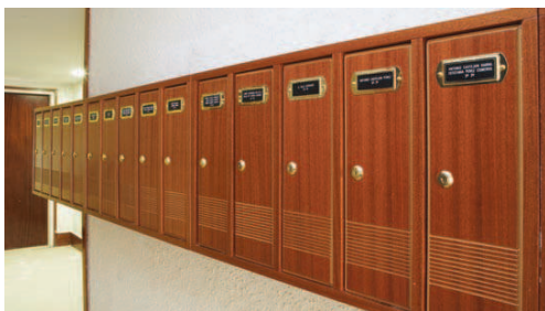
Serie de buzones TEBAS fabricados con madera de sapelly (modelo 2).

CUERPO Y PUERTA TOTALMENTE EN MADERA BARNIZADA. PUERTA DE 16 MM DE GROSOR. APERTURA LATERAL.