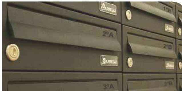
Agrupación de buzones HABITAT H-8122 color arena volcánica, con grabación a láser.