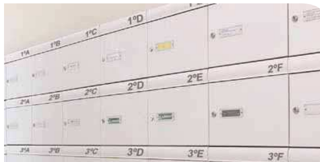
Agrupación de buzones MILENIO V-4001 blanco, con grabación a láser.