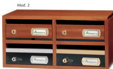
Mod. 6. Opción cerradura y tarjetero cromados, perfil plata.