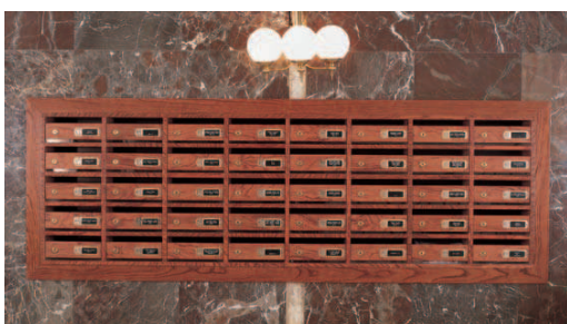
Instalación compuesta por un grupo de buzones de la serie PACÍFICO con cuerpo y puerta de bubinga barnizada.

FRENTE Y PUERTA EN MADERA BARNIZADA DE 16 MM. CUERPO EN MELAMINA. LOS MODELOS CON PUERTA DE METACRILATO INCORPORAN UN JUNQUILLO DE ALUMINIO. APERTURA HACIA ARRIBA.